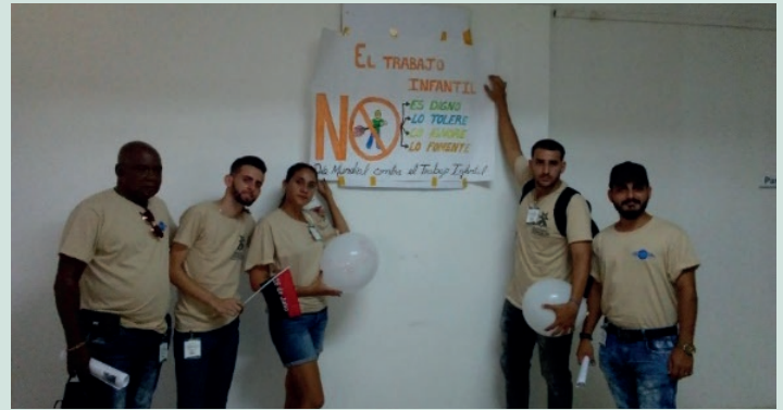
Actividades de impacto en Fórum Universitario