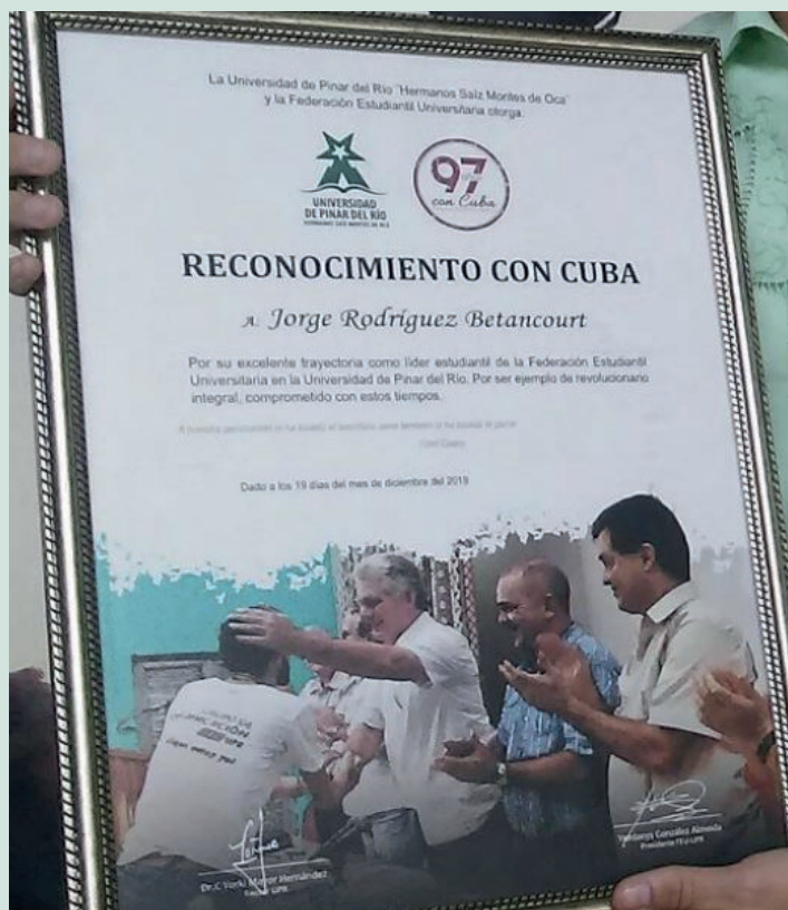
Distinción Con Cuba