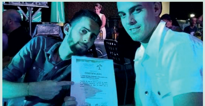
Reconocimiento. MARDELTUR 2019.