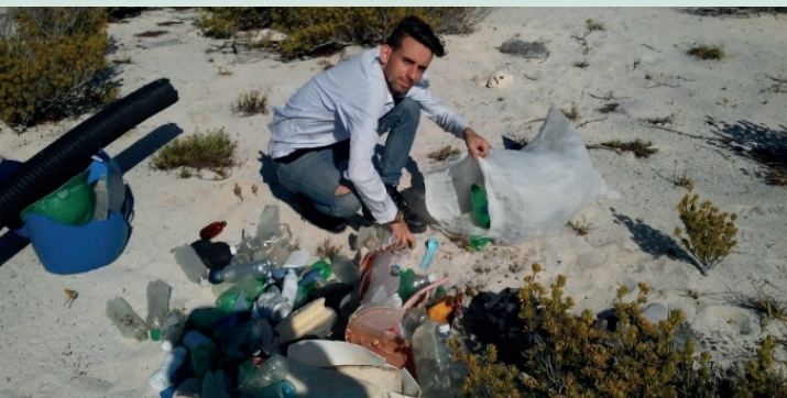
Proyecto Costa Limpia. Tarea Vida. Península de Guanahacabibes.