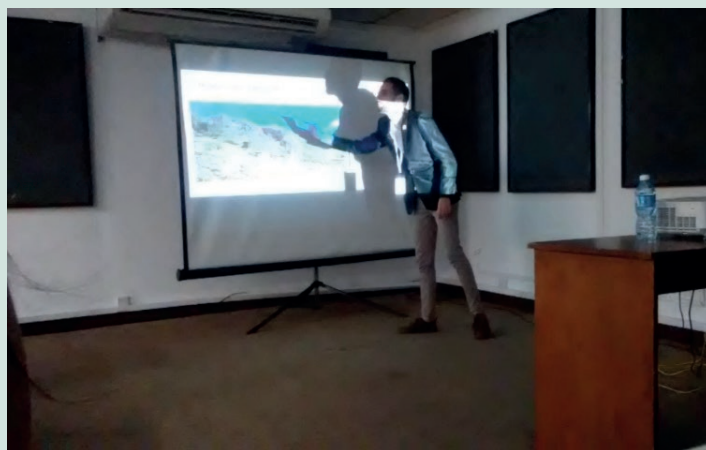
Ponencia presentada en Congreso Internacional de Ciencias de la Tierra.