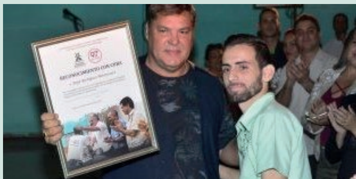
Recibe la Distinción "Con Cuba" de manos de Ramón Labañino Salazar, Héroe de la República de Cuba.