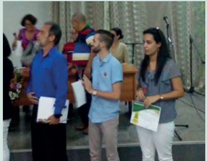
Recibiendo el Reconocimiento como Estudiante más destacado en Investigaciones de la UPR en el 2019