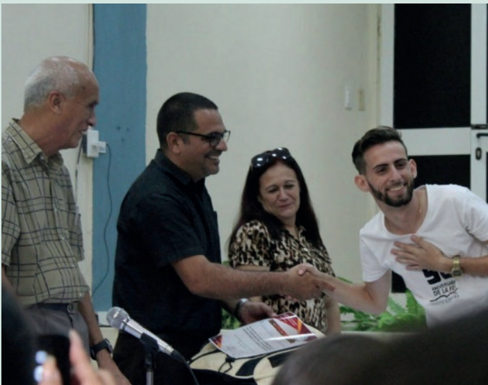
Premiación en Fórum Nacional de Estudiantes Universitarios de Ciencias Técnicas en Universidad de Camagüey.