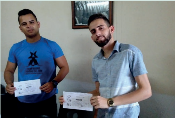
Premio Relevante en Jornada Científica del Departamento de Historia-Marxismo.