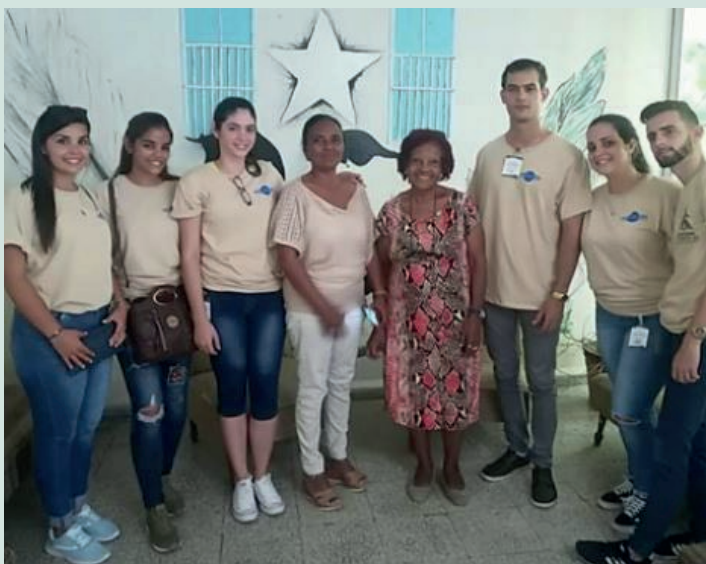
Concurso de habilidades en Fórum Nacional de Estudiantes de Ciencias Técnicas. Universidad de Camagüey.