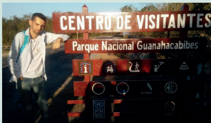
Grupo Científico Casimbas por dentro en la Península de Guanahacabibes. Investigación Playa El Holandés.