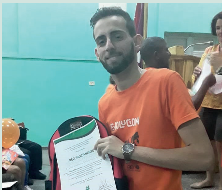
Premiación Evento Regional Evolucion. Saludarte