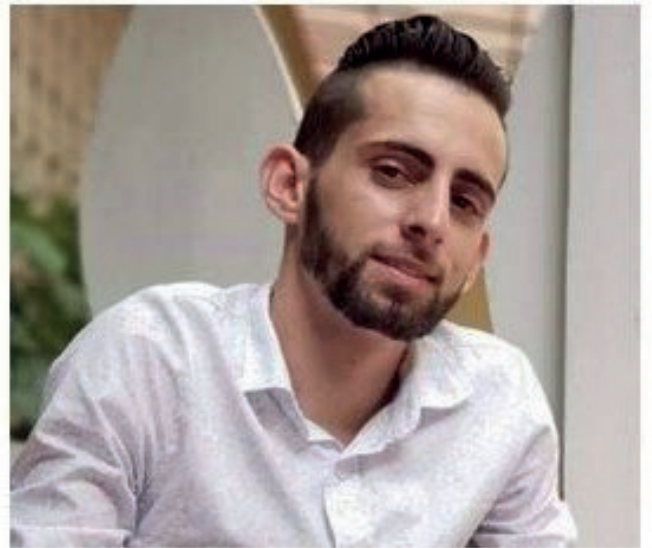
Declaraciones para Radio Guamá sobre participación en la Caravana de la Victoria

“Llevo tres años participando en la Caravana de la Victoria, entrando cada 17 de enero a la ciudad de Pinar del Río. Reeditar esa hazaña es vivirla, es rememorar un momento trascendental en la historia de Vueltabajo, es formar parte y sentirme parte de la historia”.